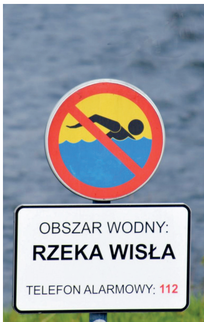
Tabliczki na brzegu rzeki przypominają o całkowitym zakazie kąpieli w Wiśle

W tym roku na terenie Mazowsza działa 35 zarejestrowanych i ogólnodostępnych kąpielisk oraz kilkadziesiąt tzw. miejsc okazjonalnie wykorzystywanych do kąpieli – ich wykaz dostępny jest w Serwisie Kąpieliskowym Głównego Inspektoratu Sanitarnego ( www.gis.gov.pl ). Co istotne – żadnego z nich nie ma na terenie gminy Konstancin-Jeziorna. W Wiśle, Jeziorce i innych zbiornikach wodnych znajdujących się na jej terenie obowiązuje zakaz kąpieli. Osoby, które świadomie i z premedytacją go łamią, będą musiały się liczyć z konsekwencjami – karą nagany lub grzywną do 250 zł. Poza tym rzeki, szczególnie Wisła, są bardzo zdradliwe, a nierozważna zabawa może zakończyć się tragicznie. Tak jak miało to miejsce 19 czerwca w Górze Kalwarii, gdzie w Wiśle życie straciło