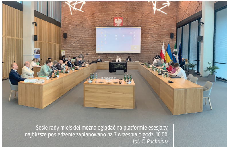
Sesje rady miejskiej można oglądać na platformie esesja.tv, najbliższe posiedzenie zaplanowano na 7 września o godz. 10.00

Ponadto rajcy byli za nadaniem ulicy, znajdującej się na działkach ewidencyjnych nr 9/14, 9/15, 53, 54/1 z obrębu 03-26 w Konstancinie-Jeziornie, nazwy Bukowa (uchwała nr 518/VIII/39/2022).