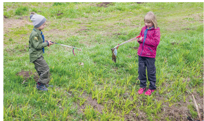
Podczas sprzątania najczęściej zebrano m.in. torebek foliowych oraz plastikowych butelek

Samorząd Konstancina-Jeziorny wspiera takie obywatelskie akcje. Magistrat ich organizatorom i uczestnikom zapewnia bezpłatnie worki i rękawice, a Zakład Gospodarki Komunalnej odbiera zebrane odpady. Magistrat zachęca też mieszkańców gminy do informowania pracowników wydziału Gospodarki Komunalnej i Spraw Lokalowych urzędu (nr tel. 22 484 23 70–74) o zaśmieconych miejscach lub o planowanych inicjatywach społecznych sprzątania. Dzięki wysypiska można zgłaszać poprzez Gminny System Informacji Przestrzennej, zakładka: Zgłoś problem. W przypadku terenów prywatnych zgłoszenia takie należy kierować do Straży Miejskiej w Konstancinie-Jeziornie (nr tel. 22 484 24 91). ✖