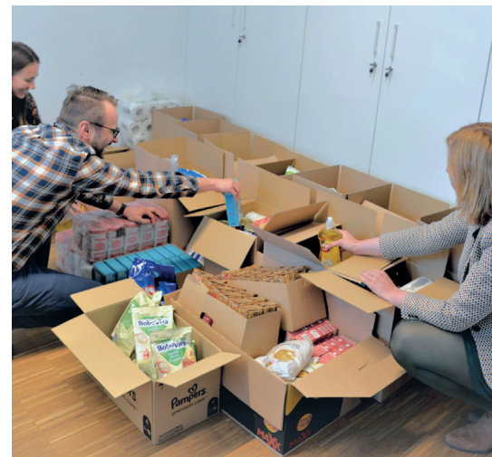
Dary przekazane przez Auchan oraz zebrane wśród pracowników magistratu zostały posegregowane i przekazane potrzebującym