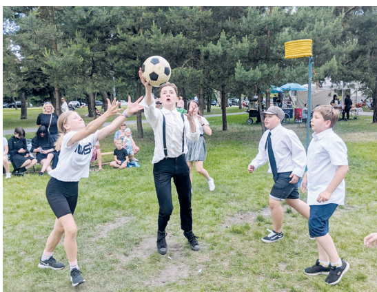
Uczniowie z Hranic i Konstancina-Jeziorny wzięli udział w pokazowym turnieju korfbal, który od wielu lat prężnie rozwija się w naszym mieście