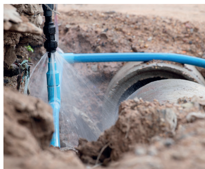
Czerpanie wody z hydrantów przeciwpożarowych jest kradzieżą i za jej nielegalny pobór grozi grzywna