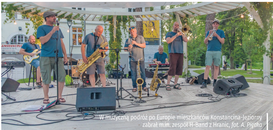
W muzyczną podróż po Europie mieszkańców Konstancina-Jeziorny zabrał m.in. zespół H-Band z Hranic

w wyjątkowych, nowoczesnych aranżacjach. Z kolei Duo Superb postawił na muzyczną różnorodność – od pieśni klasycznych kompozytorów po muzykę rozrywkową i piosenki ludowe. 12 czerwca czeszy i niemieccy goście wzięli udział w Dniach Konstancina. Goście razem z mieszkańcami przeszli w Retro Paradzie oraz bawili się na pikniku w Parku Zdrowym. Dodatkowo młodzie sportowcy z Hranic oraz ich polscy rówieśnicy stanęli naprzeciwko siebie na polanie przy KDK Hugonówka w przyjacielskim meczu korbballu. Tutaj nie liczyła się wygrana, a dobra zabawa. Jubileusz partnerstwa był okazją zarówno do podsumowań, jak też i wspomnień. ✨