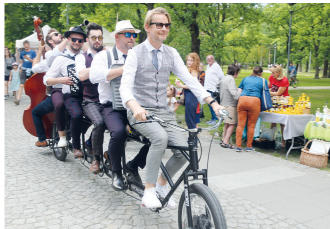
Orkiestra na Dużym Rowerze koncertowała w Parku Zdrojowym, jeżdżąc alejkami 6-osobowym jednośladem