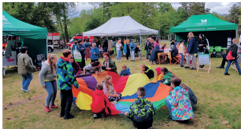
Na pikniku swoje stoisko miał m.in. Hufiec Uroczysko Konstancin, który organizował liczne zabawy dla dzieci

Na pikniku nie mogło zabraknąć stoiska Wydziału Promocji i Współpracy Zagranicznej Urzędu Miasta i Gminy Konstancin-Jeziorna. Każdy, kto nas odwiedził, mógł wybić pamiątkową monetę z herbem gminy lub tężnią solankową, willą Kamilin lub Gryf, a także własnoręcznie wykonać przypinkę według własnego projektu graficznego. Na najmłodszych czekał kącik plastyczny i drobne upominki w postaci gadżetów promocyjnych, dla dorosłych były mapy, informatory oraz przewodniki.