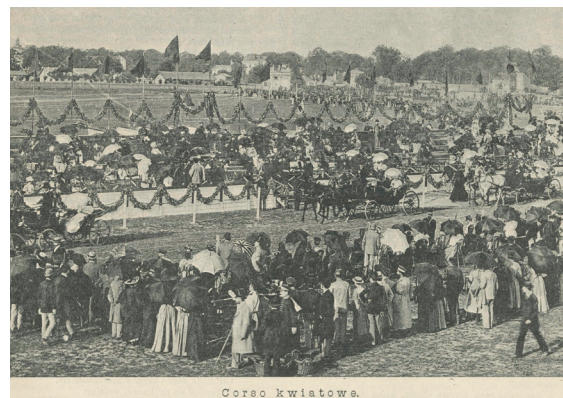
Corso kwiatowe na Polu Mokotowskim w Warszawie w 1898 r.