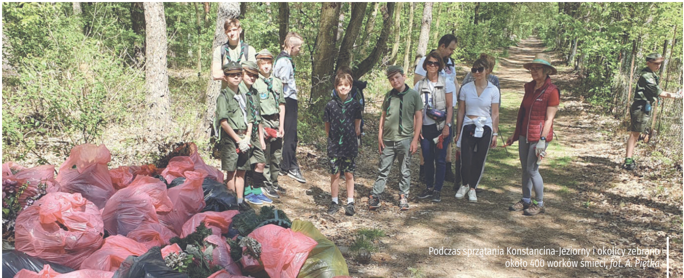
Podczas sprzątania Konstancina-Jeziorny i okolicy zebrano około 400 worków śmieci