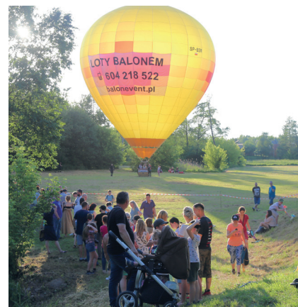
Amatorzy mocnych wrażeń ustawili się w długiej kolejce, by na własnej skórze poczuć emocje lotu balonem i podziwiać panoramę naszego miasta