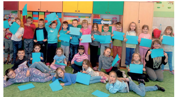
Kolor niebieski jest symbolem obchodów Światowego Dnia Świadomości Autyzmu, fot. SP nr 1

Spółeczność Szkoły Podstawowej nr 1 w Konstancinie-Jeziornie uczciła Światowy Dzień Świadomości Autyzmu. W geście solidarności z osobami z zaburzeniami spektrum autyzmu uczniowie i grono pedagogiczne placówki ubrali się na niebiesko.