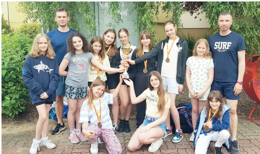
Uczennice Szkoły Podstawowej nr 2 w Konstancinie-Jeziornie zostały mistrzyniami Mazowsza w pływaniu drużynowym

Nie mniej emocjonalnie było podczas zawodów w minipiłce nożnej klas IV–VI, które rozegrano na stadionie Międzyszkolnego Uczniowskiego Klubu