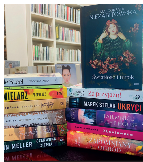
Książkowe nowości czekają na czytelników w konstancińskiej bibliotece