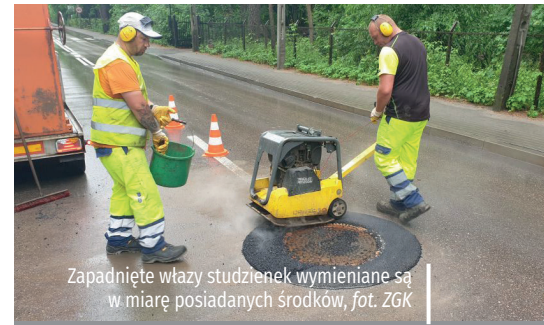
Zapadnięte włazy studzienek wymieniane są w miarę posiadanych środków

Zapadnięte lub wystające włazy studzienek kanalizacyjnych to prawdziwa zmora kierowców – niszczą zawieszania samochodów, a przede wszystkim mogą powodować niebezpieczeństwo na drodze. Dlatego Zakład Gospodarki Komunalnej w Konstancinie-Jeziornie systematycznie je naprawia. W 2022 r. przeznaczył na ten cel ponad 70 tys. zł. Tegoroczne prace związane z wymianą i regulacją włazów studni sanitarnych w drogach powiatowych przebiegających przez naszą gminę już się zakończyły. Na podstawie umowy prowadziła je firma Komunal System S.C. z Gliwic. Wyregulowanych zostało łącznie 25 studzienek w ulicach: Piłsudskiego, Chylickiej, Długiej i Wareckiej. W trakcie robót wykorzystywane były nowoczesne narzędzia i technologie. Prace polegały na wycięciu asfaltu po okręgu, demontażu starego włazu, wykonaniu podbudowy z pierścieni betonowych, montażu włazów żeliwnych, zgodnie z istniejącym profilem drogi. Odtworzona została także, mieszanką asfaltobetonową na gorąco, nawierzchnia drogi. – Roboty były wykonywane bardzo sprawnie i obyło się bez zamykania ulic – przyznaje Edward Skarzyński, dyrektor ZGK.