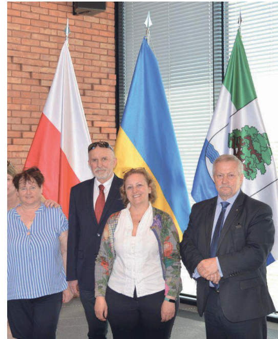
Po kilkumiesięcznej przerwie do Konstancin-Jeziorny ponownie zawitała oficjalna delegacja z partnerskiego miasta Pisogne we Włoszech

Pisogne to położone u podnóża Alp, nad jeziorem Iseo w północnych Włoszech, miasto partnerskie Konstancina-Jeziorny. Umowa o współpracy została podpisana 6 czerwca 2008 r. Uroczystości sygnowali ją ówcześni burmistrzowie