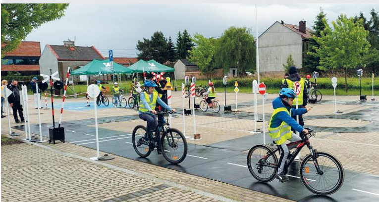
Dzieci wykazały się bardzo dobrą znajomością przepisów drogowych