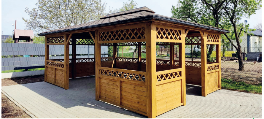
W ramach Budżetu Partycypacyjnego Gminy Konstancin-Jeziorna edycja 2022 w Bielawie powstało bezpieczne i funkcjonalne miejsce spotkań dla mieszkańców. To jeden z czterech zwycięskich projektów inwestycyjnych zrealizowanych w tym roku, fot. UMIG

Mieszkańcy gminy Konstancin-Jeziorna na zgłaszanie swoich pomysłów mieli czas między 10 a 31 maja. Mogli to zrobić zarówno przez internet, jak i drogą tradycyjną – na formularzu papierowym. W tym okresie do Urzędu Miasta i Gminy wpłynęło 19 projektów, na łączną kwotę ponad 802 tys. zł. Teraz są one weryfikowane przez komisję przeprowadzającą procedurę kształtowania budżetu partycypacyjnego, która analizuje zgłoszone zadania pod kątem formalnym i merytorycznym, w tym możliwości ich realizacji. Listę projektów dopuszczonych do głosowania – które zaplanowano od 1 do 15 września – poznamy do 15 lipca, a pod koniec września wyniki. Zwycięskie zadania zostaną wpisane do projektu budżetu na 2023 r. Podobnie jak w poprzedniej edycji budżetu partycypacyjnego, tak i w tej na realizację pomysłów miesz-