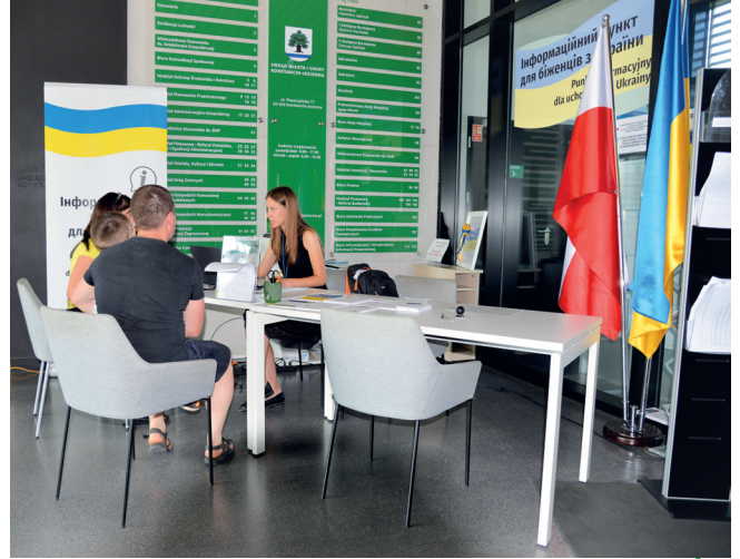
By pomóc w załatwieniu formalności oraz uzupełnieniu wniosków także do innych instytucji, w magistracie działa – od poniedziałku do piątku w godz. 9.00–15.00 – punkt informacyjny, obsługiwany przez osobę biegle posługującą się językiem ukraińskim, fot. G. Skorupski

Od 24 lutego, czyli od początku wojny za naszą wschodnią granicą, do 30 czerwca w Urzędzie Miasta i Gminy Konstancin-Jeziorna uchodźcom z Ukrainy nadano 1 781 numerów PESEL. Nie oznacza to jednak, że tyle osób przybyło i mieszka w naszej gminie – wniosek o nadanie PESEL-u można bowiem złożyć w dowolnym magistracie w Polsce. Tutaj bardziej miarodajna jest liczba osób, która zawnioskowała do Ośrodka Pomocy Społecznej w Konstancinie-Jeziornie o jednorazowe wsparcie w wysokości 300 zł. Taką pomoc otrzymało już 1 561 osób na łączną kwotę 450,9 tys. zł (stan na 30 czerwca). Świadczenia są realizowane na bieżąco. Na ten cel gmina otrzymała od wojewody mazowieckiego 453,8 tys. zł. Pieniądze te niemal w całości zostały już rozdysponowane i wkrótce samorząd zwróci się o kolejną transzę. W konstancińskim OPS-ie uchodźcy mogą ubiegać się także o świadczenia rodzinne. Są to m.in. zasiłek rodzinny czy pielęgnacyjny. Do tej pory wnioski o ich przyznanie, w różnej formie, złożyło 57 osób. Wypłacono ponad 28,9 tys. zł. Ośrodek finansuje także posiłki dla ukraińskich dzieci, uczęszczających do gminnych szkół i przedszkoli, w ramach rządowego programu „Posiłek w domu i w szkole”. Do końca czerwca z dożywiania skorzystało 204 dzieci. Koszt to ponad 52,1 tys. zł. Konstanciński OPS realizuje też rekompensatę (40 zł za jedną osobę dziennie) mieszkańcom, którzy przyjęli pod