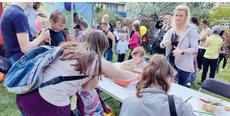
Na konstancińskim osiedlu Mirków z okazji Dnia Dziecka bawili się i mali, i duzi

zostały odwołane. W 2021 r. było odrobinę lepiej – zrealizowanych zostało 10 przedsięwzięć. W tym roku nasze życie nareszcie wróciło do normalności, a mieszkańcy znowu chętnie działają na rzecz lokalnej społeczności. W marcowym naborze o wsparcie finansowe gminy złożono 19 wniosków. Wszystkie zostały przyjęte do realizacji na łączną kwotę 50 tys. zł. I tak na przykład pod koniec kwietnia w Gassach seniorzy kultywowali wielkanocne tradycje, a w warsztatach kulinarnych zorganizowanych w miejscowej świetlicy, uczestniczyło ponad 70 osób. W maju miały miejsce kolejne działania: w Kawęczynku – „Majowe śpiewanie”, w Konstancinie-Jeziornie – „Powitanie sezonu wypoczynkowego w uzdrowisku, w tym warsztaty biblioteczne, wokalne i dietetyczne dla seniorów z Grapy i Mirkowa”, a w Słomczynie bawiono się na rekreacyjno-kulinarnym pikniku. Dużym sukcesem okazał się także piknik sportowo-rekreacyjny z okazji Dnia Dziecka. 2 czerwca na osiedlu Mirków bawiło się ponad 100 osób. Były konkursy, gry i zabawy, słodka kawiarenka przygotowana przez seniorów, a do tańca przygrywał zespół Majtki Pana Kapitana. To jednak nie wszystko, w najbliższych miesiącach realizowane będą kolejne zadania, w tym m.in. rewitalizacja budynku socjalnego Ochotniczej Straży Pożarnej w Słomczynie, Dzień Seniora czy piknik rodzinny z okazji święta pieczonego ziemniaka. ✖