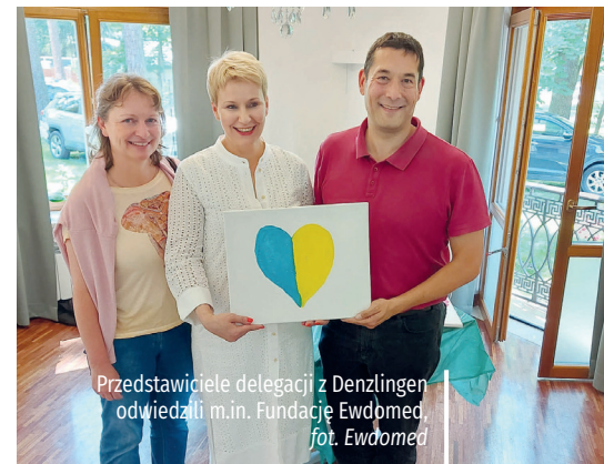
Przedstawiciele delegacji z Denzlingen odwiedzili m.in. Fundację Ewdomed

Spotkanie miast partnerskich Konstancin-Jeziorna, Hranice i Denzlingen zostało zorganizowane w ramach projektu „Europa – unsere gemeinsame Adresse/naše společná adresa/nasz wspólny adres”, współfinansowanego przez Unię Europejską.