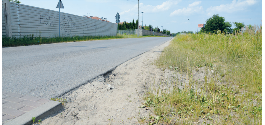
W ramach inwestycji na ul. Powsińskiej w Bielawie planowana jest budowa m.in. jezdni, chodników i ścieżki rowerowej. Oferty w postępowaniu przetargowym można składać do 20 lipca, fot. G. Skorupski

Z kolei na rozbudowę sieci kanalizacji sanitarnej oraz sieci wodociągowej w miejscowościach położonych we wschodniej części gminy konstanciński samorząd ma otrzymać 3,92 mln zł rządowego wspar-