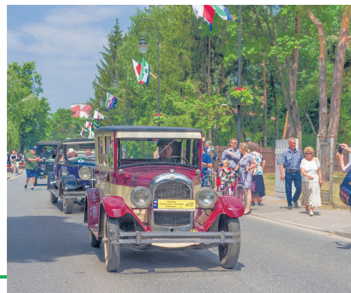
Wystylizowanym uczestnikom Dni Konstancina towarzyszyły zabytkowe samochody i jednoślady, które wzbudzały zachwyt nie tylko najmłodszej publiczności