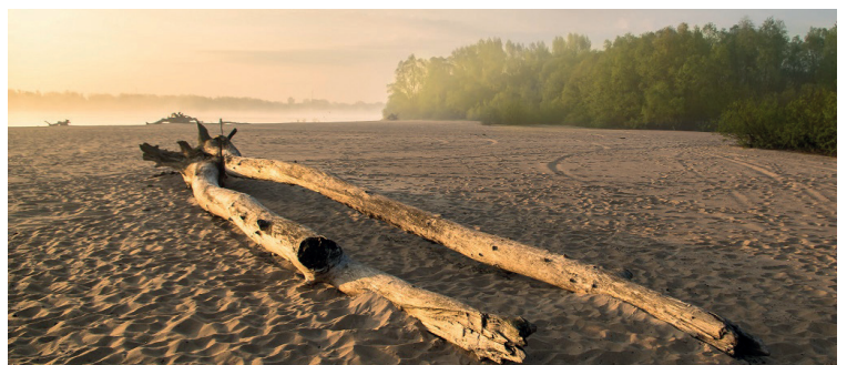
Wista i jej dzikie brzegi są miejscem gniazdowania wielu chronionych gatunków ptaków

się z nią zapoznać. Można również skorzystać z aplikacji Mazowieckie Rezerwy Przyrody. Umożliwia ona weryfikację terenu, który chcemy odwiedzić. Poza pewnością, że nie łamiemy prawa zyskamy także dostęp do wielu ciekawych informacji na temat rezerwatów, m.in. zdjęć roślin i zwierząt, banku głosów ptaków, gier edukacyjnych czy wirtualnych spacerów. Z telefonem lub innym urządzeniem mobilnym w rękę poznamy otaczającą nas przyrodę, a co za tym idzie łatwiej będzie nam zrozumieć zakazy i ograniczenia wprowadzone na chronionych terenach. ✖