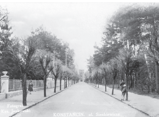
Aleja Sienkiewicza w okresie międzywojennym, fot. Zbiory Wirtualnego Muzeum Konstancina

portal historyczny Okolice Konstancina www.okolicekonstancina.pl