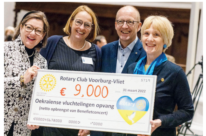
Podczas koncertu charytatywnego zebrano 9 tys. euro, fot. www.midvliet.nl

w Słomczynie, a także do stowarzyszeń i fundacji opiekujących się obywatelami Ukrainy, którzy przybyli do naszego kraju. Zebrane przez darczyńców z Leidschendam-Voorburg pieniądze umożliwią kontynuowanie tej pomocy. ✕