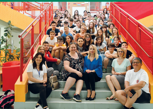
Uczniowie mieli możliwość nie tylko uczestniczyć w wielu zajęciach integracyjnych, brali również udział w warsztatach i wycieczkach