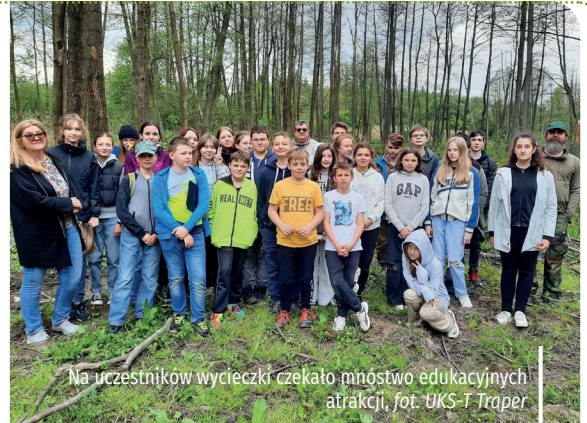
Na uczestników wycieczki czekało mnóstwo edukacyjnych atrakcji