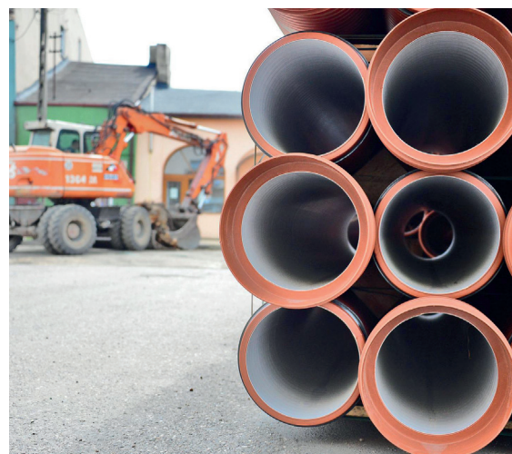
Wkrótce rozpoczną się prace w południowych sołectwach gminy

Gmina Konstancin-Jeziorna wyłoniła w postępowaniu przetargowym wykonawcę budowy infrastruktury wodno-kanalizacyjnej w rejonie południowych sołectw. Zadanie zostało podzielone na dwie części – pierwsza obejmuje wykonanie sieci kanalizacji sanitarnej (wraz z odcinkami od kanałów ulicznych do granic nieruchomości) oraz sieci wodociągowej (z odcinkami wodociągów do granic nieruchomości) w Cieciszewie i Parceli. Druga część dotyczy Kawęczynka, gdzie powstaną odcinki sieci kanalizacyjnej oraz wodociągowej (z odgałęzieniami do granicy pasa drogowego). W obu przypadkach odtworzona zostanie także nawierzchnia dróg uszkodzonych w czasie robót. W postępowaniu za najkorzystniejsze uznane zostały oferty złożone przez konsorcjum firm: Sławomir Dymowski IBF – lider i IBF Budownictwo sp. z o.o. – partner. Kontrakty na realizację inwestycji zostały podpisane pod koniec kwietnia. Ich łączna wartość to ponad 11,1 mln zł, z czego część kosztów zadania – 5 mln zł – zostanie pokryte z Rządowego Funduszu Polski Ład. Wkrótce rozpoczną się prace. ✖