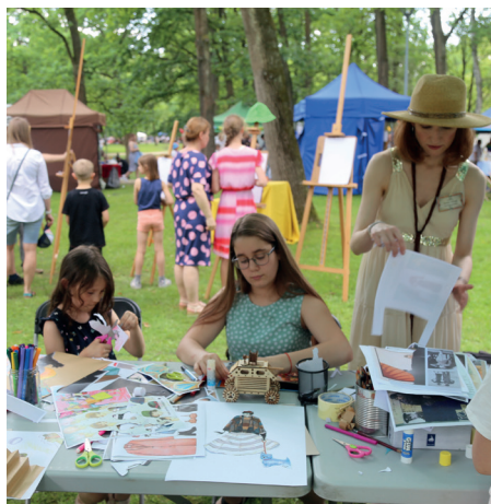
Dniom Konstancina towarzyszyły warsztaty artystyczne dla dzieci i dorosłych, m.in. „Retro-Kolaż”