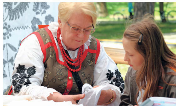
Wszechobecnym motywem był haft wilanowski. Zawitości trudnej sztuki haftowania można było poznać w czasie warsztatów

i naturą człowieka. Z kolei najmłodsza publiczność zachwycił spektakl „Legends wiślane”. ✖