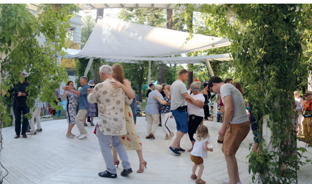
Od energetycznych rytmów rozbrzmiewających ze sceny amfiteatru nogi same rwały się do tańca, co było widać w altanie na Balu Apaszów, gdzie zagrała Stylowa Orkiestra Taneczna, fot. G. Traczyk