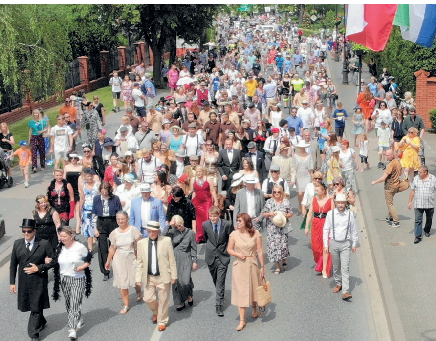
Tegoroczny Piknik Retro, nawiązujący do lat 20. i 30., rozpoczęła tradycyjna parada, która – entuzjastycznie witana przez publiczność – przeszła ulicami naszego miasta ze Starej Papierni do Parku Zdrojowego

W Konstancinie-Jeziornie czas znów cofnął się do lat 20. i 30. XX wieku. Mnóstwo dobrej zabawy dla dzieci i dorosłych, świetne koncerty i szereg dodatkowych atrakcji. Były stare samochody, rowery, stroje i muzyka. Tak wyglądały Dni Konstancina 2022.