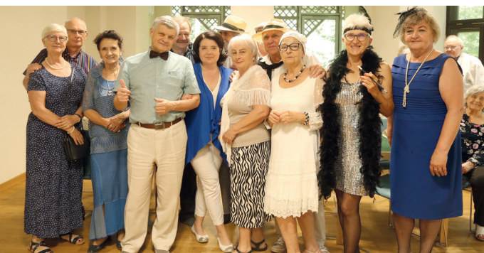
Podczas Retro Turnieju Brydża zawodnicy byli przebrani w stroje nawiązujące do lat 20. i 30. minionego wieku