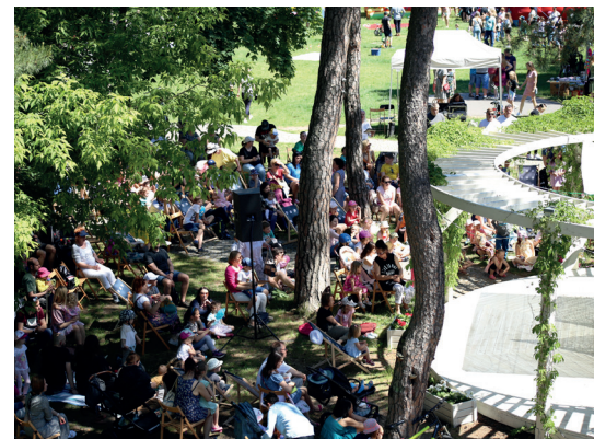
Spektakle i koncerty w altanie cieszą się niezmiennie ogromną popularnością

W niedzielne przedpołudnia lata o godz. 11.00 zapraszamy na bezpłatne zajęcia jogi dla wszystkich spragnionych ruchu i świeżego powietrza. To świetna okazja, by zrobić coś dla ciała oraz ducha. Zajęcia