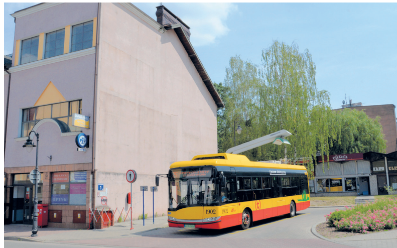
Szpecące reklamy zniknęły między innymi z budynku przy ul. Wilanowskiej 1, w którym mieści się Poczta Polska

Do usunięcia tablicy lub urządzenia reklamowego niezgodnego z przepisami uchwały zobowiązany jest podmiot, który je umieścił. Jeżeli nie jest możliwe jego ustalenie, odpowiedzialność spada na właściciela, użytkownika wieczystego lub posiadacza samoistnego nieruchomości lub obiektu budowlanego. W wyniku kontroli będą wszczynane postępowania administracyjne, które finalnie mogą zakończyć się nałożeniem wysokiej kary pieniężnej – 112 zł dziennie plus 10 zł za każdy metr kwadratowy pola powierzchni reklamy, licząc od daty wszczęcia postępowania. Powyższe stawki określa ustawa o podatkach i opłatach lokal-