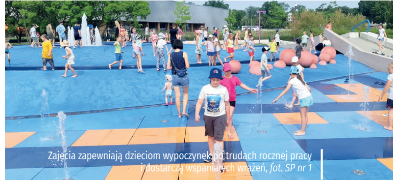
Zajęcia zapewniają dzieciom wypoczynek po trudach rocznej pracy i dostarczą wspaniałych wrażeń

Tegoroczne „Lato w mieście” w Gminnym Ośrodku Sportu i Rekreacji w Konstancinie-Jeziornie odbędzie się w czterech tygodniowych turnusach: 18–22 lipca, 25–29 lipca, 1–5 sierpnia oraz 8–12