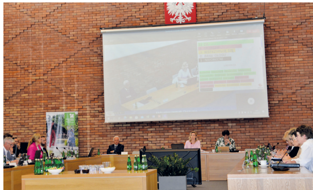
Absolutorium dla burmistrza tak, wotum zaufania nie – tak zdecydowali radni miejscy na czerwcowej sesji

Konstancińscy rajcy pozytywnie natomiast ocenili realizację ubiegłorocznego budżetu. Za udzieleniem absolutorium burmistrzowi zagłosowało 11. radnych, 6. było przeciw, a kolejnych 3. wstrzymało się od głosu (jedna osoba była nieobecna na sesji). Pozytywną opinię o sprawozdaniu finansowym za 2021 r. wydała również Regionalna Izba Obrachunkowa. – Chciałbym wszystkim