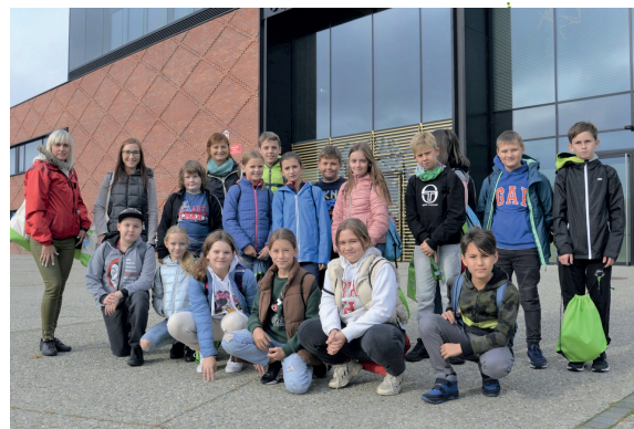
Czescy i polscy uczniowie przed konstancińskim ratuszem

To była bardzo intensywna wizyta. W ciągu pięciu dni, od 26 do 30 września, dziesięciu uczniów i dwie nauczycielki z zaprzyjaźnionej Szkoły Podstawowej 1 Maje w Hranicach mogli lepiej poznać naszą gminę i zintegrować się z uczniami Trójki. W tym roku uczestnicy międzynarodowej wymiany odwiedzili m.in. ratusz, w którym spotkali się z Dariuszem Zielińskim, zastępcą burmistrza gminy. W pobliskim Mirkowie mieli okazję uczestniczyć w warsztatach w Muzeum Wycinanki. A w konstancińskiej Trójce uczestniczyli w lekcji języka angielskiego, uczyli się naszego narodowego tańca – poloneza, zagraли także towarzyski mecz korfbal – gry uczącej współpracy i zdrowej rywalizacji. Nocleg dla uczniów z Hranic zapewnili polskie rodziny. Był to wspaniały czas wzajemnego poznawania kultur i obyczajów. Rewizyta polskich uczniów planowana jest na maj 2023 r.