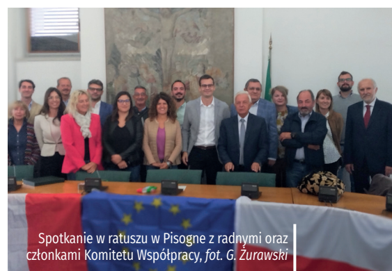
Spotkanie w ratuszu w Pisogne z radnymi oraz członkami Komitetu Współpracy

stępcy oraz radni. Dla strony włoskiej była to okazja do zaprezentowania członków nowo powstałego Komitetu Współpracy Miast. Omówione zostały także dotychczasowe efekty dwustronnych kontaktów oraz kierunki dalszej współpracy partnerskiej. Konstancinianie zwiedzili też ratusz, a podczas bezpośrednich rozmów z jego pracownikami zapoznali się z funkcjonowaniem urzędu i zadaniami realizowanymi przez samorząd. Był też czas na nieformalne spotkanie z wolontariuszami, którzy organizują pomoc dla Ukrainy. Oprócz oficjalnej delegacji w Pisogne przebywała, w ramach wymiany międzyszkolnej,