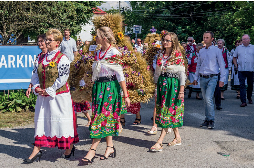
Tradycyjnie obchody dożynek gminnych rozpoczęły się korowodem i prezentacją wienców. Po nich odprawiona została dziękczynna msza polowa

Gmina Konstancin-Jeziorna hucznie obchodziła tegoroczne święto plonów. Na wszystkich, którzy 4 września odwiedzili Opacz, czekało mnóstwo atrakcji. Był tradycyjny korowód dożynkowy, konkurs na najpiękniejszy wieniec, turniej sołectw, występy artystyczne i zabawa taneczna. Działo się naprawdę wiele.