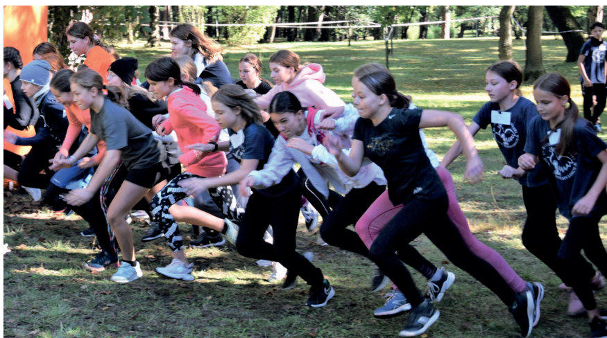
W gminnych biegach przełajowych wystartowało aż 166 zawodników

Uczniowie startowali też w biegach sztafetowych. Gminne zawody zorganizowano pod koniec września w Parku Zdrojowym. Rozegrano je w kilku kategoriach wiekowych. Pierwsze miejsce zajęli uczniowie