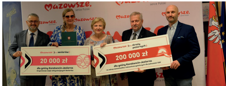
21 lipca w Konstancińskim Domu Kultury odbyło się uroczyste podpisanie umów na dofinansowanie trzech zadań o łącznej wartości 220 tys. zł

Tym razem samorząd Mazowsza wsparł dwie Ochotnicze Straże Pożarne. 100 tys. zł trafiło do Słomczyna na zakup średniego wozu z napędem na cztery koła. Jednostka na nowy samochód ratowniczo-gaśniczy pozyskała także 450 tys. zł z Narodowego oraz Wojewódzkiego Funduszu Ochrony Środowiska i Gospodarki Wodnej. 550 tys. zł to wkład własny gminy Konstancin-Jeziorna, a 100 tys. zł pochodzi z budżetu powiatu piaseczyńskiego. Umowa z wykonawcą została już podpisana. Najkorzystniejszą ofertę w postępowaniu przetargowym złożyła firma Moto-Truck z Kielc, a opiewa ona na kwotę 982 770 zł. Kolejne 100 tys. zł to wsparcie dla OSP Konstancin-Jeziorna z przeznaczeniem na zakup ciężkiego samochodu ratowniczo-gaśniczego z napędem 4x4. Jego całkowity koszt to 1 271 820 zł. Pozostałe pieniądze pochodzą z budżetu gminy – 720 tys. zł, z Ministerstwa