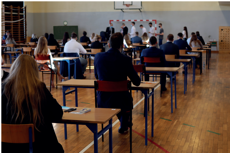
W tym roku do egzaminu przystąpiło 274 uczniów z sześciu publicznych szkół podstawowych

Matematyka to przedmiot, który od lat sprawia uczniom najwięcej kłopotów.