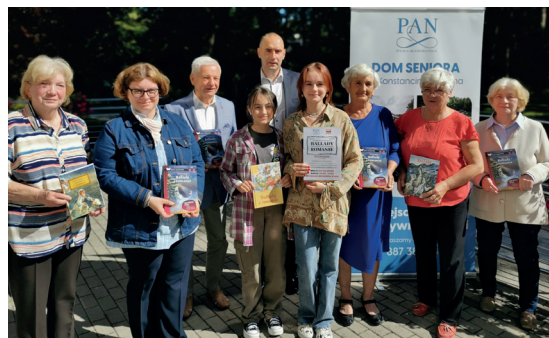
Konstancińską Radę Seniorów podczas akcji Narodowego Czytania wspierali pracownicy Domu Seniora PAN oraz młodzież