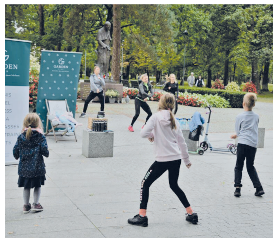
Spacerowicze mogli wziąć udział w pokazowych zajęciach m.in. zumbi i jogi