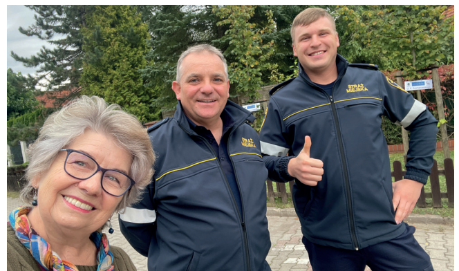
Na pikniku sąsiedzkiem nie mogło zabraknąć m.in. strażników miejskich

dziękują także lokalnym instytucjom i firmom: Urzędowi Miasta i Gminy Konstancin-Jeziorna, Konstancińskiemu Domowi Kultury, Zakładowi Gospodarki Komunalnej oraz Euroterm24.pl i Grast&MTB Designer. ✘