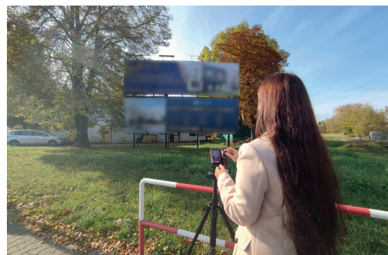
Kontrole urzędników będą prowadzone tak długo, póki z ulic nie znikną wszystkie nielegalne reklamy

konstancińskiego magistratu uzbrojeni w dalmierz laserowy, urządzenie do pomiaru odległości i powierzchni, od kilku miesięcy prowadzą wizje lokalne na konstancińskich ulicach. Ich efektem są 22 postępowań administracyjne w sprawie nałożenia kary pieniężnej. Obecnie w toku jest też 36 postępowań przygotowawczych zmierzających do ustalenia właściciela nielegalnego urządzenia reklamowego. Jeśli nie uda się tego zrobić, odpowiedzialność za jego usunięcie spadnie na właściciela, użytkownika wieczystego lub posiadacza samoistnego nieruchomości lub obiektu budowlanego, na którym on stoi. W razie jakichkolwiek pytań dotyczących zapisów uchwały krajobrazowej, zachęcamy do