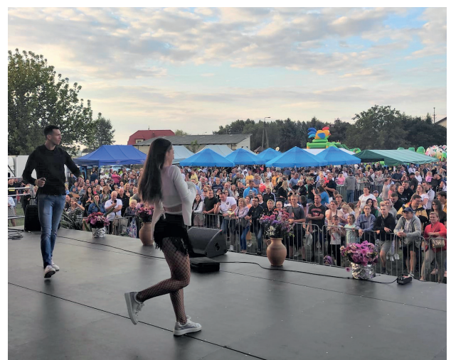
Do zabawy i tańca publiczność podrywała Kapela Siostr Piotrowicz oraz zespoły Bayera (na zdjęciu) i Boogie Night, fot. A. Jarzębska-Isio