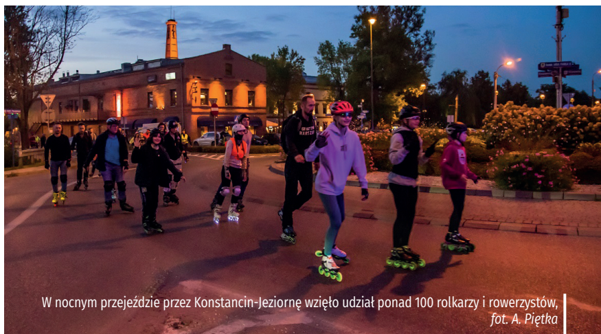
W nocnym przejeździe przez Konstancin-Jeziornę wzięto udział ponad 100 rolkarzy i rowerzystów, fot. A. Piętko