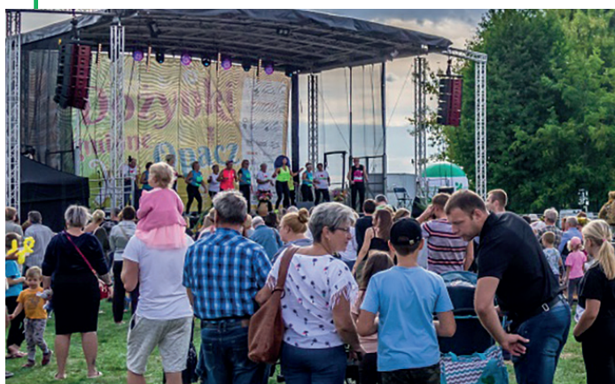
Na scenie, która stanęła na boisku przy Szkole Podstawowej nr 6, wystąpili: uczniowie Szóstki, tancerze z Egurrola Dance Studio, grupy ER-nesta i Zumba Gold Senior z Gminnego Ośrodka Sportu i Rekreacji, a także Łurzyczanki, zespół śpiewaczy Powsinianie z Centrum Kultury Wilanów, zespół ludowy Ktosowianki ze Złotokłosu, Jarzębina Czerwona i Majtki Pana Kapitana