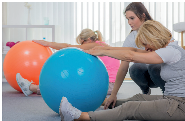
W 2023 r. do Szkoły Podstawowej nr 6 w Opaczy wrócą zajęcia sportowo-rekreacyjne

W tej edycji budżetu partycypacyjnego mieszkańcy gminy Konstancin-Jeziorna mogli wybierać spośród 13 projektów, które przeszły pozytywną weryfikację komisji powołanej przez burmistrza i zostały zakwalifikowane do etapu głosowania. Odbyło się ono w dniach 1–15 września, a wzięto w nim udział ponad 2 tys. osób. Tradycyjną formę głosowania – w punkcie stacjonarnym – wybrało 1 140 mieszkańców, a przez internet – 931. Oddano łącznie 3 273 ważne głosy. Do realizacji w przyszłym roku trafi osiem projektów, w tym trzy inwestycyjno-remontowe – w tej kategorii najwięcej głosów (698) otrzymał projekt „Poprawa bezpieczeństwa przy szkołach podstawowych – skrzyżowania na wyniesieniu” oraz pięć z zakresu m.in. kultury, rekreacji i edukacji – tutaj na szczycie listy rankingowej z 663 głosami znalazł się projekt „Działalność koncertowa Konstancińskiego Chóru Kameralnego”. W tej kategorii cztery projekty nie uzyskały minimalnej liczby głosów, która wynosiła 100. Zgodnie z zarządzeniem burmistrza w tym roku na realizację zadań w ramach Budżetu Partycypacyjnego Gminy Konstancin-Jeziorna – edycja 2023 przeznaczono 400 tys. zł, z czego na zadania