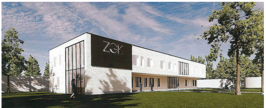
Widok na elewację frontową, od ul. Wareckiej, nowego budynku administracyjno-biurowego ZGK, proj. Archigraf Michał Brutkowski