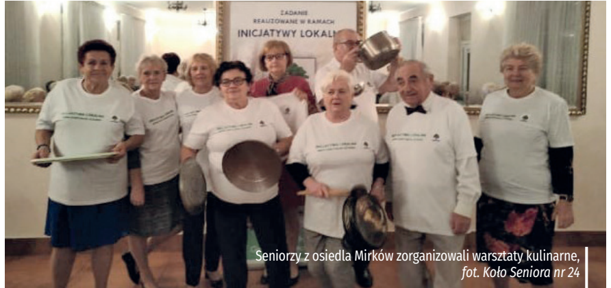
Seniorzy z osiedla Mirków zorganizowali warsztaty kulinarne