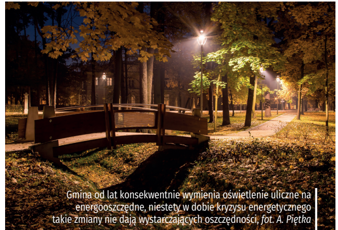
Gmina od lat konsekwentnie wymienia oświetlenie uliczne na energooszczędne, niestety w dobie kryzysu energetycznego takie zmiany nie dają wystarczających oszczędności