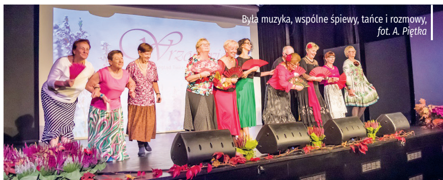
Była muzyka, wspólne śpiewy, tańce i rozmowy

To było prawdziwe święto seniorów. Tegoroczne Wrzosowiska w Konstancińskim Domu Kultury upłynęły tradycyjnie pod znakiem tańca, śpiewu i dobrej zabawy.