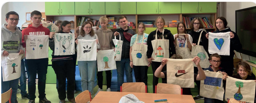
Uczniowie z zaprojektowanymi przez siebie torbami zakupowymi, fot. SP nr 1