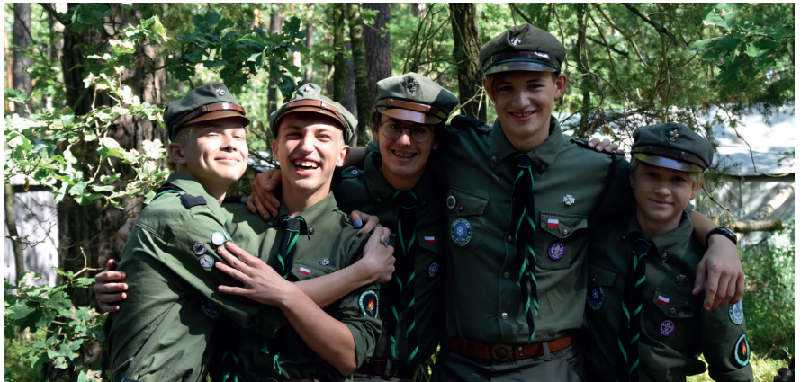
W harcerstwie można poznać prawdziwych przyjaciół

Każde nasze spotkanie ma jasno postawione cele wychowawcze i zamierzenia. Wcielamy to w życie w taki sposób, by