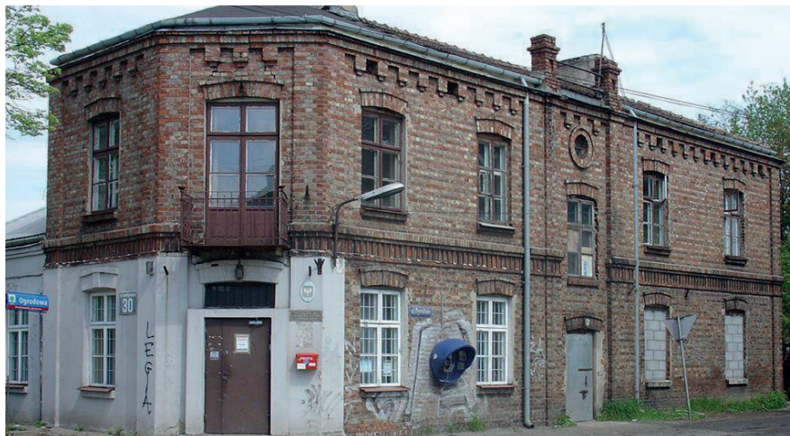
Nieistniejący już budynek z początków XX w. przy ul. Ogrodowej, na którego tyłach znajdował się posterunek niemiecki (2004 r.), fot. P. Komosa

Przed posterunkiem niemieckim w Jeziornie zgromadził się tłum, lecz żołnierze zapewne nie mieli informacji o pokojowym, w większości przypadków, rozbijaniu wojsk w Warszawie. Na wezwanie tłumu do poddania się pięciu niemieckich żołnierzy odpowiedziało strzałami. To sprawiło, iż zgromadzeni przypuścili szturm. Wywiązała się strzelanina. Ostatecznie Polacy wdarli się do budynku i rozbili zabarykadowanych Niemców. Jeden z żołnierzy został zabity, pozostali dotkliwie