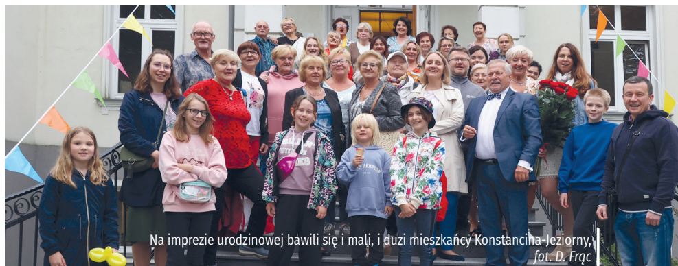
Na imprezie urodzinowej bawili się i mali, i duzi mieszkańcy Konstancina-Jeziorny