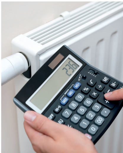
Jeden wybrany dodatek energetyczny przysługuje na jeden adres

Jako pierwszy został uruchomiony dodatek węglowy. Jest to jednorazowe wsparcie finansowe w wysokości 3 tys. zł dla gospodarstw domowych, których podstawowym źródłem ogrzewania jest paliwo stałe w formie węgla kamiennego, brykietu lub peletu (zawierające co najmniej 85 proc. węgla kamiennego). Surowiec ten musi być spalany m.in. w kotle, kominku, kociole, kuchni węglowej czy piecu kaflowym. Warunkiem otrzymania pieniędzy jest posiadanie wpisu w Centralnej Ewidencji Emisyjności Budynków. Choć wnioski o dodatek węglowy można było składać od połowy sierpnia, to dopiero na początku października gmina Konstancin-Jeziorna otrzymała od wojewody mazowieckiego pierwszą transzę pieniędzy na jego wypłatę. To ponad 2,1 mln zł. Ale już wiadomo, że ta kwota będzie niewystarczająca. Do tej pory (stan na 25 października) wniosków o świadczenie złożyło do Ośrodka Pomocy Społecznej w Konstancinie-Jeziornie ponad tysiąc mieszkańców naszej gminy