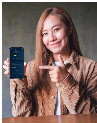
Aplikacja jest bezpłatna i nie zawiera reklam

Pobranie i korzystanie z Evenio jest całkowicie bezpłatne. Po zainstalowaniu aplikacji jesteśmy proszeni o określenie naszej lokalizacji: miejscowości, ulicy i numeru domu oraz o informację, czy mieszkamy w bloku czy w domu jednorodzinnym, po czym aplikacja automatycznie ściąga aktualny harmonogram odbioru śmieci w naszym rejonie. Ważnym