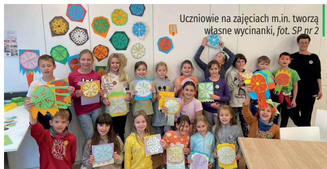
Uczniowie na zajęciach m.in. tworzą własne wycinanki, fot. SP nr 2

to przegląd filmów etno „Kolędnicy i kowale – obrzędowość i rzemiosło w filmach z archiwum naukowego Państwowego Muzeum Etnograficznego” (od 17 do 20 listopada). Z kolei w grudniu, w każdy weekend, zaplanowano program „Zrób sobie święta” – cykl warsztatów, pokazów filmowych, spektakli i koncertów. Wstęp wolny. Więcej informacji na hugonowka.pl. ✖