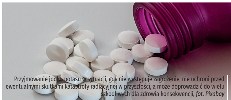
Przyjmowanie jodku potasu w sytuacji, gdy nie występuje zagrożenie, nie uchroni przed ewentualnymi skutkami katastrofy radiacyjnej w przyszłości, a może doprowadzić do wielu szkodliwych dla zdrowia konsekwencji

W gminie Konstancin-Jeziorna wyznaczono 11 punktów, które w razie wystąpienia zdarzenia radiacyjnego będą dystrybuować tabletki jodku potasu.