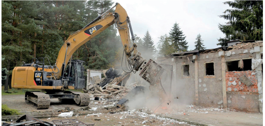
Baraki, w których do tej pory mieściły się biura ZGK, zostały już wyburzone. Wkrótce ława fundamentowa nowego budynku zostanie zalana betonem