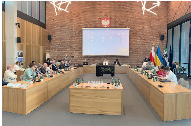
Obrady Rady Miejskiej, po pandemii COVID-19, wróciły do normalności i odbywają się w sali posiedzeń ratusza, fot. C. Puchniarz