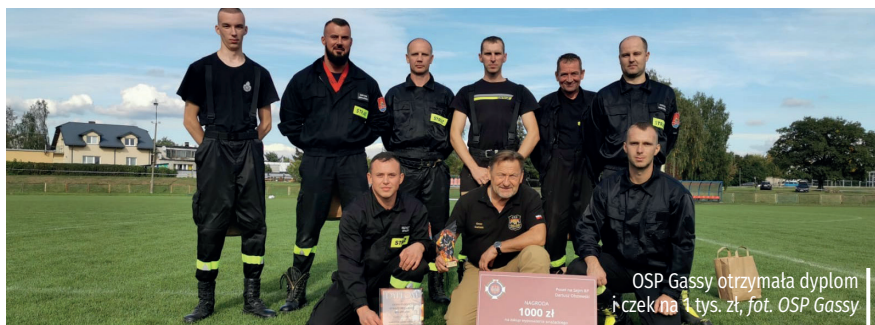
OSP Gassy otrzymała dyplom i czek na 1 tys. zł, fot. OSP Gassy

Strażacy z Ochotniczej Straży Pożarnej w Gassach zajęli trzecie miejsce w powiatowych zawodach sportowo-pożarniczych.