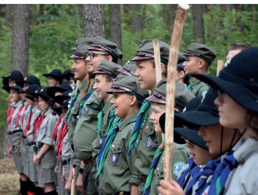
Harcerze podejmują wiele oddolnych inicjatyw oraz uczestniczą w lokalnych wydarzeniach, fot. Hufiec Uroczysko Konstancin