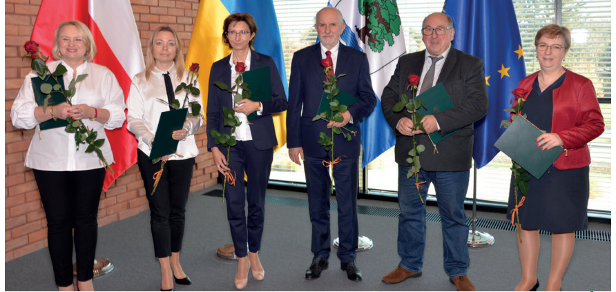
Wśród wyróżnionych z okazji Dnia Edukacji Narodowej byli m.in. wszyscy dyrektorzy gminnych szkół podstawowych