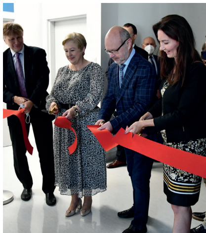
W oficjalnym otwarciu odnowionych przestrzeni szpitala udział wzięły m.in. władze Mazowsza i gminy Konstancin-Jeziorna