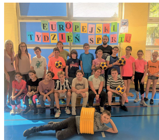
W sportowym święcie uczestniczyli uczniowie zerówki oraz z klas od 1 do 8, fot. SP nr 3

Nauczyciele wychowania fizycznego, edukacji wczesnoszkolnej oraz wychowawcy ze świetlicy w Szkole Podstawowej nr 3 w Konstancinie-Jeziornie postanowili pomóc swoim uczniom w poprawie zdrowia fizycznego oraz uświadomić im, jak ważna jest każda, nawet najmniejsza aktywność. Od 20 do 30 września dzieci i młodzież mogli wziąć udział w turniejach piłki nożnej i korfbal, wyścigach, torach przeszkód, grze w boule i unihokeja. Również podczas przerw międzylekcyjnych czekały na nich liczne atrakcje – zabawy i aktywność, która miała pomóc w rozwijaniu uczniowskich zainteresowań i pasji. Nie zabrakło też niespodzianek. Jedną z nich był kurs tańca, który poprowadziła instruktorka szkoły Egurrola Dance Studio w Konstancinie-Jeziornie. A to wszystko w ramach Europejskiego Dnia Sportu i w duchu fair play.