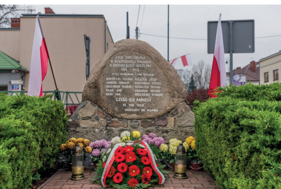
Pomnik poległych w latach 1918–1921 w walkach o niepodległość przy ul. Warszawskiej

Paweł Komosa portal historyczny Okolice Konstancina