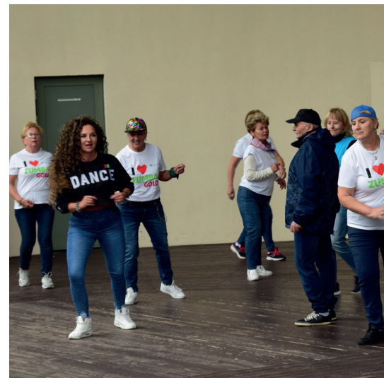
Na mieszkańców gminy Konstancin-Jeziorna czeka oferta blisko 30 różnych zajęć sportowo-rekreacyjnych skierowanych niemal do każdej grupy wiekowej, w tym seniorów

lifikowani instruktorzy sportu i fizjoterapeuci. Zapraszamy m.in. na: zdrowy kręgosłup, rehapilates, TBC, pilates, wzmacnianie i stabilizacja, body movement – ćwiczenia mobilizujące, płaski brzuch, badminton, tenis stołowy oraz nordic walking. O zdrowie i kondycję możemy też zadbać na siłowni. Jest ona czynna w poniedziałki i środy w godz. 17.00–21.50; we wtorki, w czwartki i piątki w godz. 16.00–21.50, a w soboty w godz. 9.00 do 13.00. Przypominamy, że posiadacze Konstancińskiej Karty Mieszkańca mogą liczyć na zniżkę w wysokości 10 procent w opłacie za zajęcia. GOSiR honoruje też kartę Benefit MultiSport Plus. Szczegółowe informacje na temat oferty dostępne są na stronie gosir-konstancin.pl w zakładce: Oferta zajęć/Dla dzieci i młodzieży. ✖