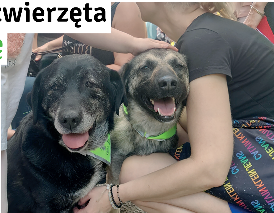
➤ Bezdomne czworonogi nadal trafiają do schroniska Prima-Vet w Czaplunku

Zabezpieczone zwierzęta niezmiennie trafiają do schroniska Prima-Vet