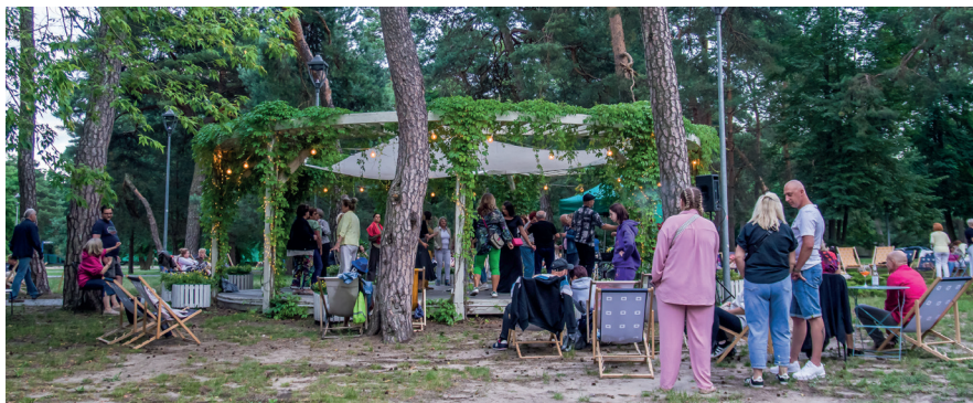
↳ Lato w Konstancinie-Jeziornie upłynie pod znakiem muzyki, tańca i kina plenerowego

Na mieszkańców gminy i turystów odwiedzających konstanciński Park Zdrojowy czeka lato pełne atrakcji. W wybrane wakacyjne, bezdeszczowe sobotnie wieczory lipca i sierpnia Konstanciński Dom Kultury zaprasza wszystkich miłośników tańca. O godz. 19.00 w altanie przy Hugonówce przy ul. Mostowej 15 będą się odbywały plenerowe potańcówki, na które wstęp jest wolny. Świetną zabawę zapewnią DJ-e. W repertuarze znajdują się melodie z pamiętnych dancingów, tanga i walce, rock'n'rollowe szaleństwo, gorące latynoskie rytmy oraz zabawa w rytmie disco. Zatańczymy przy najpopularniejszych polskich hitach oraz największych światowych przebojach. W letnim kalendarzu nie zabraknie również kameralnych koncertów w malowniczej altanie oraz w konstancińskim amfiteatrze. To idealna okazja, by spędzić letnie popołudnia przy dźwiękach znakomitej muzyki na żywo. W programie znajdują się zarówno kameralne recitale fortepianowe, jak i energetyczne brzmienia funku,