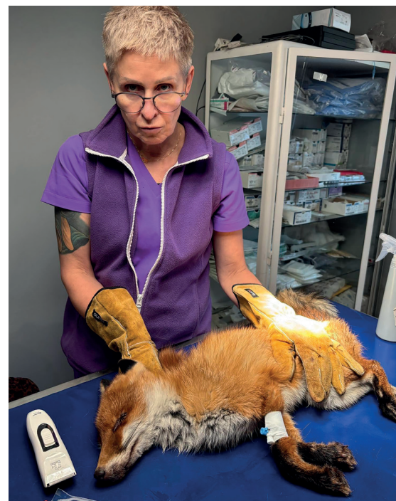
Największym wyzwaniem fundacji jest zapewnienie pożywienia i specjalistycznej opieki uratowanym dzikim zwierzętom

finansowanie ratowania dzikich zwierząt. Dlatego fundacja prowadzi zbiórkę online, dzięki której pozyskuje środki na leczenie, transport i całodobową opiekę weterynaryjną nad dzikimi zwierzętami z terenu naszej gminy. Fundacja przypomina również, aby nie zabierać młodych dzikich zwierząt z lasu, parku czy łąki – co niestety miało miejsce niedawno. W wielu przypadkach nie są one porzucone, a ingerencja człowieka może bardziej zaszkodzić, niż pomóc. Jeśli zwierzę jest ranne lub wyraźnie osłabione, należy skontaktować się z konstancińską Strażą Miejską pod numerami: 22 48 42 491 lub 602 291 864. Funkcjonariusze kierują zgłoszenia do fundacji. (aji)