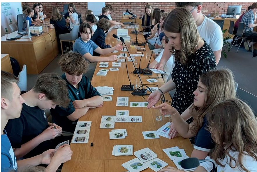
➤ Projekt Fundacji Innowatorium z zakresu partycypacji społecznej został zrealizowany w ramach otwartego konkursu ofert gminy. W szkoleniu i debacie, które odbyły się 26 i 27 maja w ratuszu, uczestniczyła konstancińska młodzież

W ramach otwartych konkursów ofert dla organizacji pozarządowych gmina przeprowadziła dotychczas osiem naborów obejmujących zadania z zakresu m.in. sportu, kultury, turystyki i krajoznawstwa, ochrony