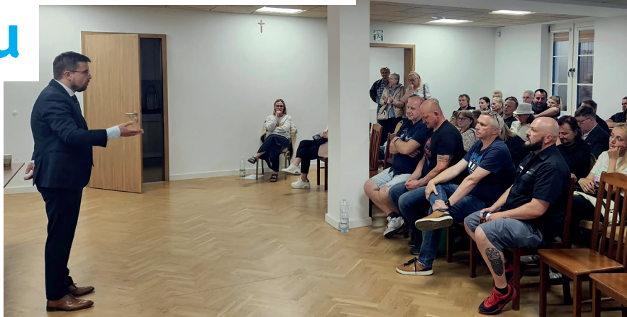
➤ Spotkania cieszą się dużym zainteresowaniem wśród mieszkańców

W tegorocznej edycji zaplanowano 16 spotkań – osiem już się odbyło. Burmistrz rozmawiał z mieszkańcami sołectw: Borowina, Kawęczyn,