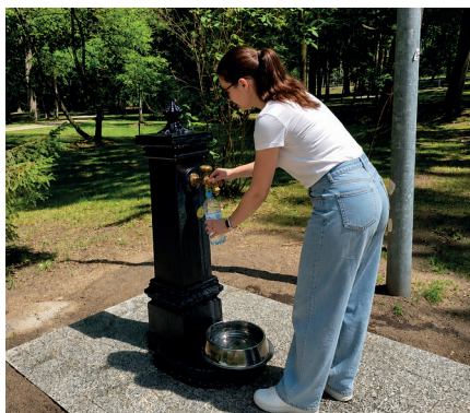
➤ Nowe poidelka pomogą zaspokoić pragnienie w upalne dni. Źródła będą czynne do wczesniej jesieni

W Parku Zdrojowym uruchomiono nowe źródła wody pitnej, które zastąpiły zużyte urządzenia. Estetyczne i funkcjonalne poidelka umożliwiają wygodne napełnianie bidonów i butelek. Znajdują się w trzech dotychczasowych lokalizacjach: przy pomniku św. Jana Pawła II, tężni solankowej oraz amfiteatrze.