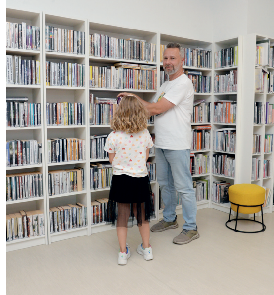
➤ Przez całe wakacje Biblioteka Publiczna będzie miejscem spotkań, zabawy i odpoczynku dla mieszkańców w każdym wieku

taty i spektakle. Przez całe lato kontynuowana będzie także ogólnopolska akcja „Mała książka – wielki człowiek”, w ramach której przedszkolaki otrzymują bezpłatne wyprawki czytelnicze. Wszystkie wydarzenia organizowane przez Bibliotekę Publiczną są bezpłatne. ↵ (tq)