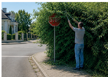
➤ Przycinanie gałęzi to obowiązek właściciela posesji

Gałęzie drzew i krzewów przerastające z prywatnych posesji do pasa drogowego to nie tylko problem estetyczny, ale przede wszystkim kwestia bezpieczeństwa. Roślinność ograniczająca widoczność na skrzyżowaniach i łukach dróg, zasłaniająca oznakowanie czy zwężająca chodniki i ścieżki rowerowe może stwarzać realne zagrożenie dla uczestników ruchu. Zgodnie z obowiązującymi przepisami właściciele nieruchomości mają obowiązek dbać o to, aby roślinność znajdująca się na ich działkach nie utrudniała korzystania z dróg publicznych. W sytuacjach, gdy gałęzie lub krzewy ograniczają skrajnię drogową, pogarszają widoczność lub utrudniają ruch, właściciele mogą zostać wezwani do usunięcia nieprawidłowości. Konstanciński magistrat apeluje do mieszkańców o systematyczne kontrolowanie stanu drzew i krzewów