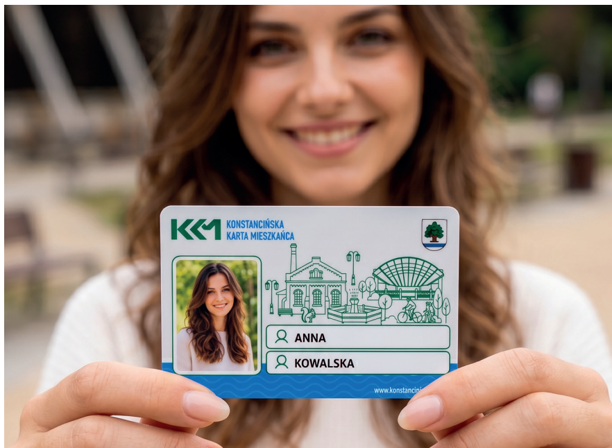
➤ Konstancińska Karta Mieszkańca zyskała nową szatę graficzną

Konstancińska Karta Mieszkańca to program skierowany do mieszkańców gminy, który od 2015 r. umożliwia korzystanie z ulg i benefitów. Posiadacze karty mogą liczyć m.in. na zniżki na produkty i usługi oferowane przez lokalnych przedsiębiorców, a także preferencyjne warunki korzystania z oferty Gminnego Ośrodka Sportu i Rekreacji oraz Konstancińskiego Domu Kultury. Program jest sukcesywnie rozwijany. Jednym z ostatnich przywilejów był bezpłatny wstęp na lodowisko przez cały sezon jego funkcjonowania. Obecnie mieszkańcy posiadający KKM mogą również bezpłatnie zaciżpować psa lub kota, a za zabiegi sterylizacji i kastracji zapłacić jedynie połowę ceny. Karta jest także zintegrowana z Warszawskim Transportem Publicznym, dzięki czemu można na niej m.in. doładować bilet miesięczny. Jej posiadacze bezpłatnie korzystają również