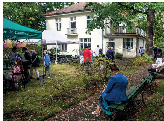
➤ Jedną z atrakcji festiwalu będzie możliwość zwiedzania ogrodu i willi Świt

Muzyka, sztuka, historia i niezwykle miejsca – wszystko to czeka na uczestników 19. Festiwalu Otwarte Ogrody w Uzdrowisku Konstancin-Jeziorna. Odbędzie się on 12–13 września.