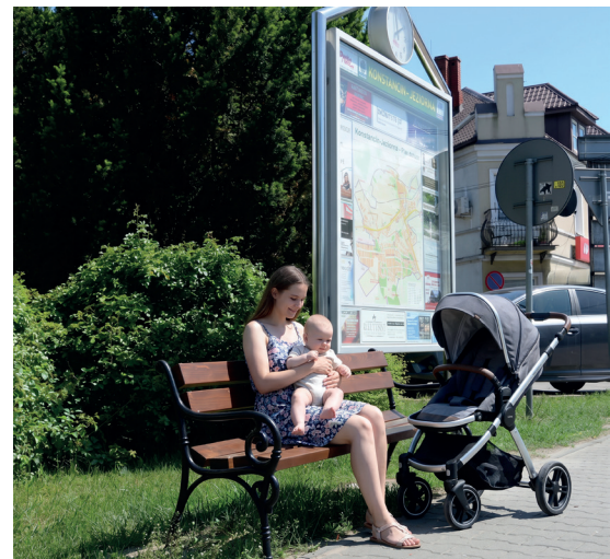
➤ Nowe ławki zamontowano m.in. przy ul. Warszawskiej

W przestrzeni publicznej przybędzie również koszy na śmieci. ZGK przeprowadził inwentaryzację pojemników – obecnie na terenie gminy jest ich 773. Aby lepiej dostosować ich rozmieszczenie do potrzeb mieszkańców, Urząd Miasta i Gminy poprosił o wskazanie miejsc wymagających ustawienia kolejnych koszy. Pierwsze propozycje zbierano podczas Rodzinnego Ekopikniku, gdzie mieszkańcy zaznaczali swoje sugestie na specjalnie przygotowanych mapach. Osoby, które nie mogły wziąć udziału w wydarzeniu, nadal mogą