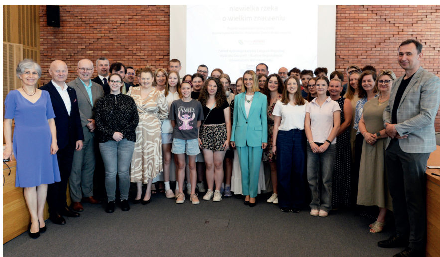
➤ Młodzież, nauczyciele i organizatorzy projektu spotkali się 19 czerwca na uroczystym zakończeniu programu