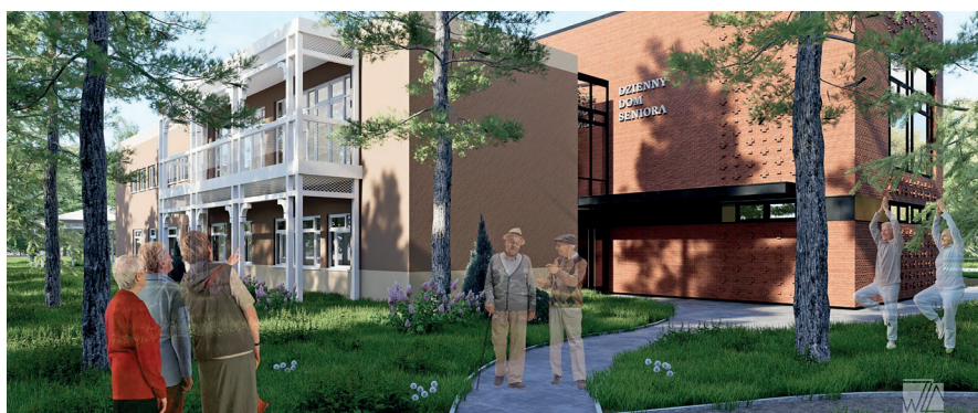
Widok projektowanego budynku od strony północno-wschodniej (fot. Woźnicki Zdanowicz Architekci)