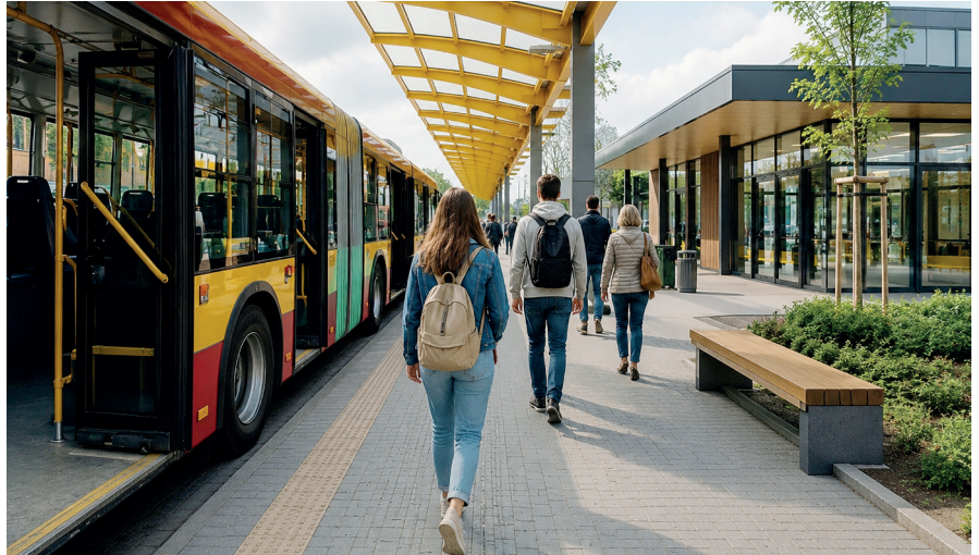
➤ Teren przy ul. Warszawskiej, znany mieszkańcom jako Żeberko, zmieni się w nowoczesny węzeł przesiadkowy, który usprawni korzystanie z transportu publicznego

Nowy węzeł przesiadkowy powstanie na gminnym terenie przy ul. Warszawskiej, znanym mieszkańcom jako Żeberko. Będzie obsługiwał zarówno podmiejskie linie Warszawskiego Transportu Publicznego, jak i lokalne linie L. Dzięki inwestycji zaniedbany dziś teren zyska zupełnie nowe funkcje i stanie się jednym z najważniejszych punktów komunikacyjnych w gmi-