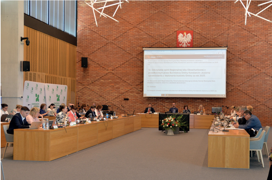
Podczas czerwcowej sesji absolutoryjnej radni debatowali nad Raportem o stanie gminy oraz wykonaniem budżetu za 2025 r.