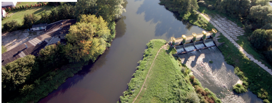
Wysokie noty Konstancin-Jeziorna uzyskał we wszystkich kategoriach

Konstancin-Jeziorna zajął 1. miejsce w województwie mazowieckim w rankingu CoolCity Index 2026. To jedno z najbardziej prestiżowych europejskich zestawień oceniających potencjał miast do adaptacji do zmian klimatu.