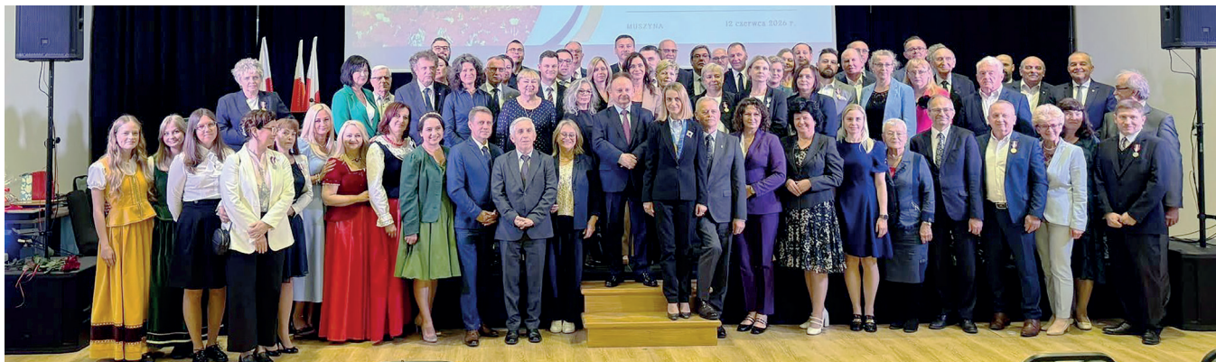
➤ W jubileuszu 35-lecia Stowarzyszenia Gmin Uzdrawiskowych uczestniczyli przedstawiciele 48 gmin z całej Polski (fot. SGU RP)