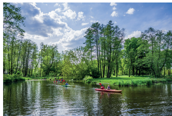
➤ Rzeka Jeziorka ma 66,3 km długości