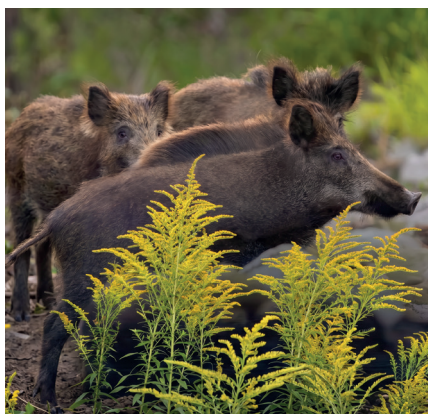
Regularne koszenie nawłoci ogranicza rozprzestrzenianie się tego inwazyjnego gatunku i chroni bioróżnorodność

Nawłoc błyskawicznie opanowuje kolejne tereny, wypierając rodzime gatunki roślin i tworząc dogodny schronienie dla dzików. Eksperti przypominają, że regularne koszenie to najskuteczniejszy sposób na ograniczenie ekspansji tego inwazyjnego gatunku.