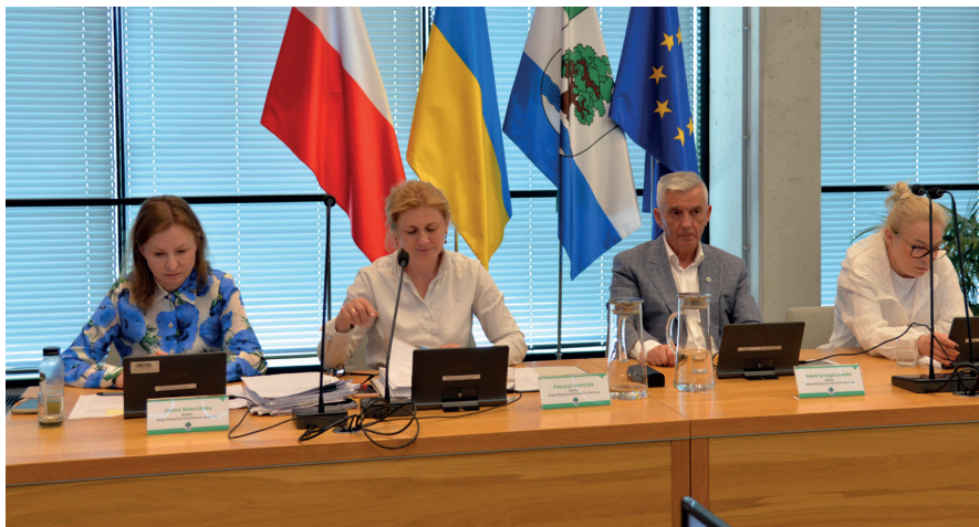
➤ Decyzje podejmowane podczas sesji Rady Miejskiej mają bezpośredni wpływ na rozwój gminy i jakość życia jej mieszkańców

Radni przyjęli wnioski pokontrolne Komisji Rewizyjnej dotyczące kontroli przeprowadzonej w Szkole Podstawowej Integracyjnej nr 5 ( uchwała nr 387/IX/31/2026 ) oraz rozpatrzyli także skargę przekazaną przez wojewodę mazowieckiego, dotyczącą braku realizacji zasady czynnego udziału strony w postępowaniu administracyjnym oraz naruszenia praw konstytucyjnych – zo-