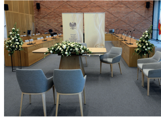
Uroczystości odbywają się w sali posiedzeń Urzędu Miasta i Gminy

podniosłą i elegancką atmosferę wydarzenia. Atutem nowego miejsca są także jego walory architektoniczne. Wnętrze sali wyróżniają ściany z czerwonej, ręcznie formowanej cegły pochodzącej z polskiej cegielni, a duża przeszklona ściana zapewnia dostęp naturalnego światła, tworząc atrakcyjną przestrzeń zarówno do organizacji ceremonii, jak i wykonywania fotografii ślubnych. Przyszłe pary młode oraz ich goście mogą również korzystać z dużego parkingu zlokalizowanego przy ratuszu. Szczegółowe informacje można uzyskać w Urzędzie Stanu Cywilnego pod numerami telefonów: 22 484 23 50 oraz 22 484 23 51. Zmiana lokalizacji sali ślubów związana jest z reorganizacją sposobu zagospodarowania dwóch gminnych budynków. Willa Kamilin przy ul. Józefa Piłsudskiego 42 została przekazana