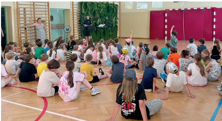
↳ Podczas wizyt na półkoloniach konstancińscy strażnicy miejscy przypominają dzieciom i młodzieży o zasadach bezpiecznego wypoczynku

Półkolonie, zajęcia sportowo-rekreacyjne, warsztaty artystyczne i multimedialne – dzieci i młodzież spędzające lato w gminie Konstancin-Jeziorna mogą wybierać spośród wielu ciekawych propozycji przygotowanych przez gminne instytucje.